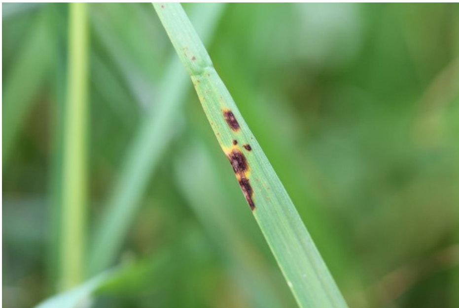
Billede 1. Angreb af bladplet i strandsvingel.

Kun frøgræshalm behandlet med Amistar/Mirador må opfodres.